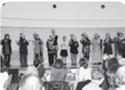
手話サークルひまわりの会 聴覚障がい者を交えた交流