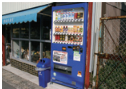
「徳永古美堂」横（中央4丁目）