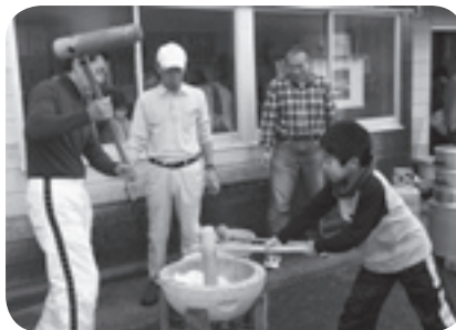
天神町区 親睦餅つき大会