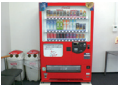
リコージャパン（株）福岡北営業所内 ※従業員専用となっています