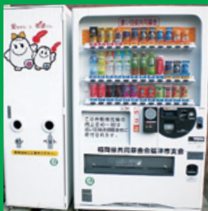
赤い羽根自動販売機 (イメージ)

福岡県共同募金会福津市支会では、地域福祉を推進するための財源確保のため、「赤い羽根自動販売機」の設置推進に取り組んでいます。この自動販売機は、清涼飲料水の自動販売機による売上の一部を寄付していただくもので、この募金は「高齢者の健康づくりや見守り活動」「地域のふれあい交流事業」等、設置した地域の身近な福祉活動に活用されます。