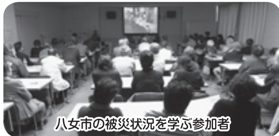
八女市の被災状況を学ぶ参加者

平成24年7月に福岡県南部などを襲った九州北部豪雨災害の際に、災害ボランティアセンターを開設し、外部のボランティアを受け入れながら、地域の自治会などと協力して住民の支援を行った八女市社会福祉協議会の取り組みを学ぶため、1月24日（木）に「災害ボランティア養成講座」を開催しました。当日は地域の福祉活動従事者、郷づくり関係者など69名が参加し、災害ボランティアセンターの役割や、災害に備えた普段の取り組みなどについて学びました。