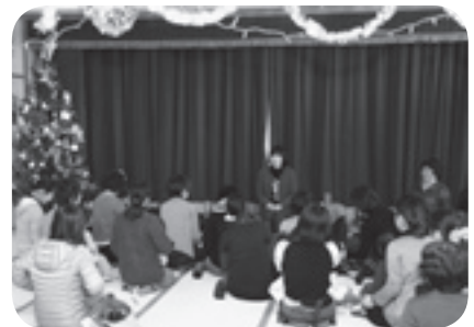
おもちゃの図書館たんぽぽ クリスマス会