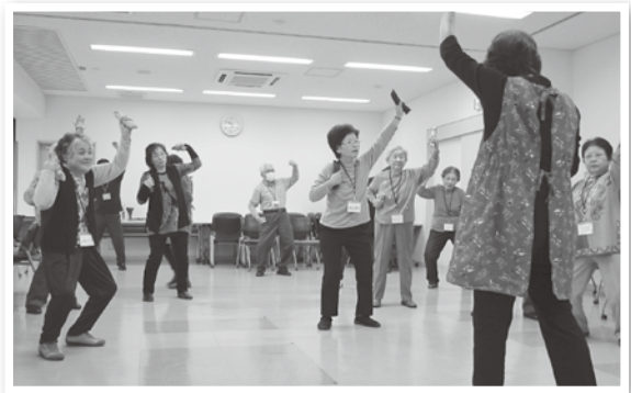
サロンを続けることで参加される方同士のつながりもできました

参加者が元気になる居場所として、毎月第3金曜日に歌に合わせて「玄米ニギニギ体操」と「てんとつむし体操」を行っています。ニギニギ棒は、握力・腕力の強化に効果的で、すべて手づくりされたそうです。また、血圧測定や手話を使った歌も取り入れ、終始なごやかな雰囲気です。サロンの開かれています。受付や会場設営、送迎など地域ぐるみで元気の居場所づくりに取り組まれています。