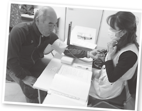
市から看護師の派遣を受け血圧測定や、簡単な健康相談も