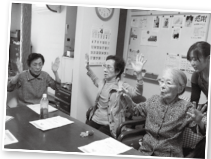
近所に住む80~90代の女性たちが集います

近所の方が集まれる場として毎月1回、自宅を開放したサロン活動が行われています。食事をしながら、おしゃべりを楽しんで後、体操をして身体をほぐしています。参加者の女性(95歳)は「自分のペースで運動できて嬉しいです」「美味しいものを食べて、身体を動かして、いつまでも元気でいたいね。人と話してボケないようにしないとね」と話してくださいました。