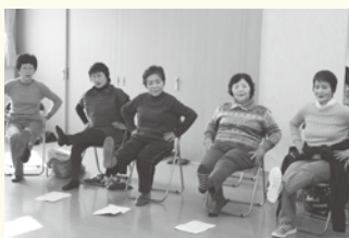
座ったままでもできる体操です

地域の行事や公民館での集まりに併せて、健康レクサポーターが『ピンシャン体操』（童謡「線路は続くよどこまでも」の歌に合せた体操）を教えに、あなたの地域にお伺いします。