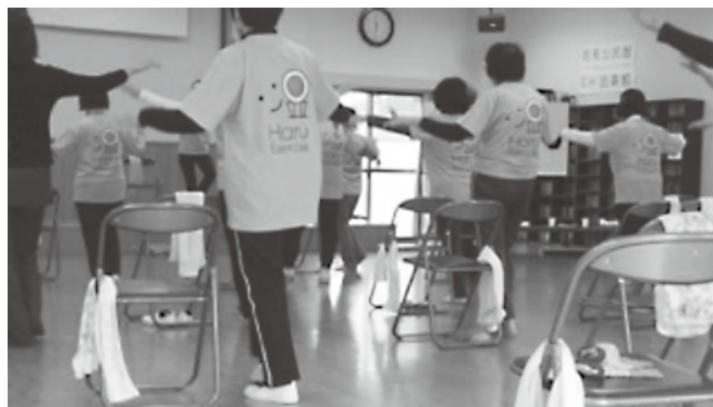
おそろいのユニフォームを着てみなさん熱心に頑張っています