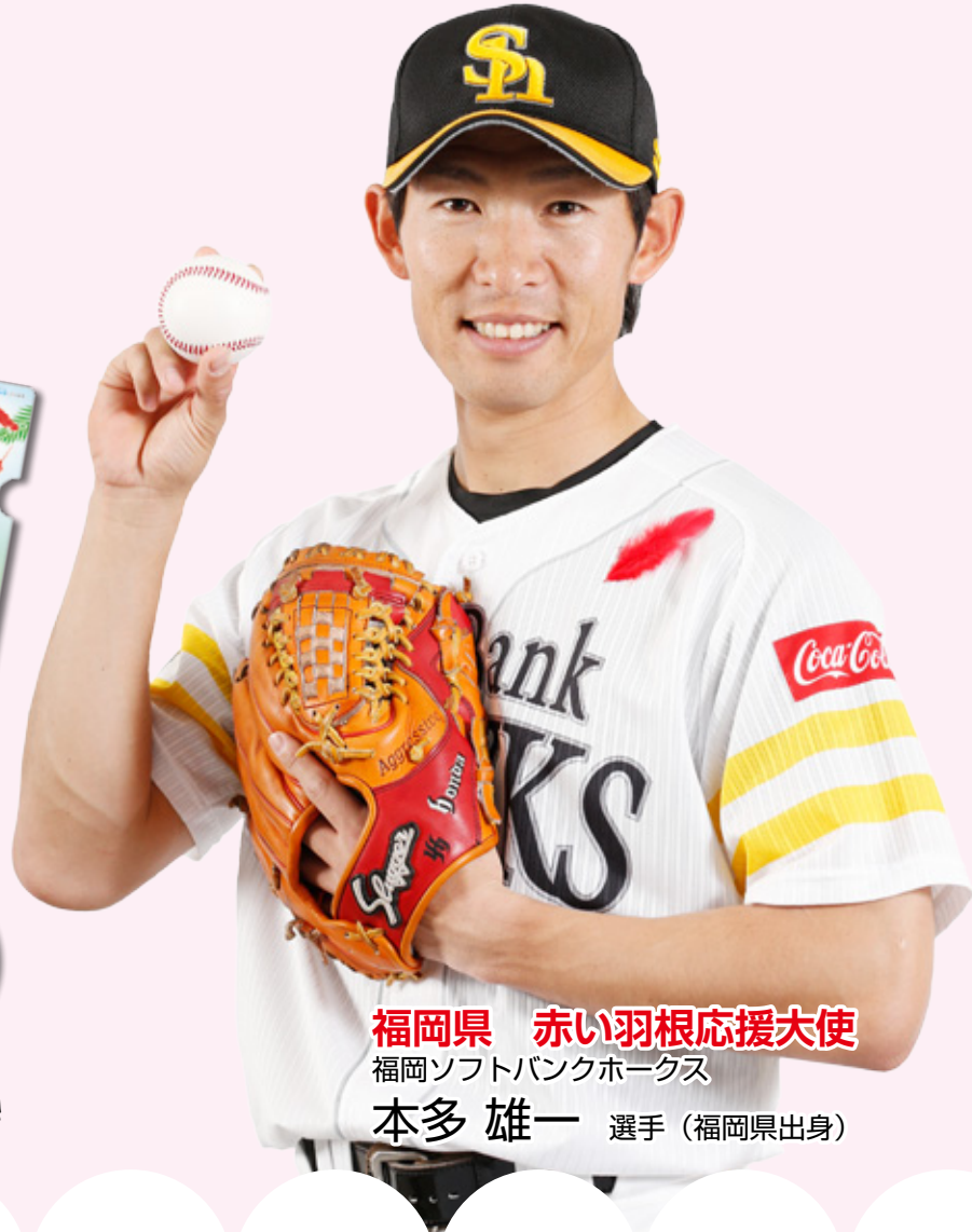
福岡県 赤い羽根応援大使 福岡ソフトバンクホークス 本多 雄一 選手（福岡県出身）

福岡ソフトバンクホークスや 妖怪ウォッチとコラボした 赤い羽根限定のオリジナルグッズも販売中！