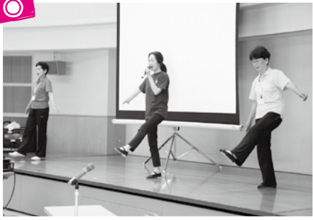
地域からのご要望に応じてピンシャン体操をお届けします(健康レクサポーター)

7月12日に「ご近所の福祉力 セミナー」を開催しました。 セミナーでは、小地域福祉 会・介護予防サロンに行った アンケート調査から見た、現 状と課題の報告、東福岡4区福 祉会と宮司3区自治会の実践報 告、健康レクサポーターによる 介護予防体操「ピンシャン体 操」の実践を行いました。