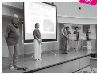
東福岡4区福祉会のみなさんによる トーンチャイムの演奏

平成28年度小地域福祉会・介護予防サロン役員研修 ご近所の福祉力向上セミナー開催