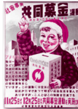
共同募金の初代ポスター