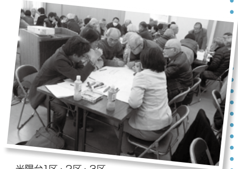
光陽台1区・2区・3区