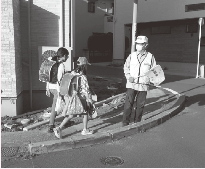
児童の登下校を見守る福祉会役員

「地域のみな様と支え合って生きる共助の精神で、地域全体が元気で明るい地域を推進する支援体制を確立する。」ことを目標に掲げ、昭和区の自治会長や民生委員・児童委員