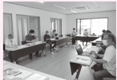
活動内容を検討する福祉会役員

状況の中で、どのような活動ができるか議論を重ねてきました。結果、今年度は児童の登下校の見守り隊の結成、高齢者世帯等への資源ごみ等の回収支援、自治会内の環境整備などに取り組みしていくこととなりました。9月28日(月)には、初回の登下校中の児童の見守りを行い、福祉会としての最初の活動がはじまりました。元気で明るい地域の実現のため、今後の活動が期待されます。