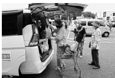
外出支援活動 (星ヶ丘区福祉会)

(医)静かな海の会 津屋崎中央病院 銭花電工 筑前津屋崎人形巧房 豊村酒造(有) 西野木材(株) (株)ハナダ建設 (有)瑞宝苑 (有)津屋崎サニタリー