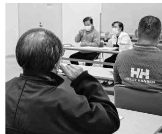
手話の学習会の開催 (福津市手話サークルひまわりの会)