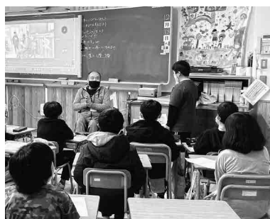
障がいのある方と児童との交流 (市内小中学校)

東福岡6区福祉会 西福岡1福祉会 的岡区小地域福祉会 本町区福祉会 若木台2区福祉会 若木台3区サポートの会 若木台4区福祉会 若木台5区福祉会 若木台6区福祉会 天寿会 四角区福祉会 光陽台2区福祉会