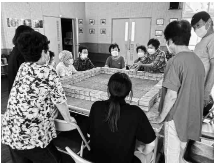
サロンでのコミュニケーション麻雀 (東福岡6区福祉会)

福津市では、おおむね自治会ごとで設立され、地域の見守り活動やサロン活動、分別収集支援等の生活支援などを行う「小地域福祉会」の活動や、障がい者や家族を介護する方々の当事者団体の活動支援、手話や音訳などのボランティア活動の推進等の様々な地域の福祉活動に活用されています。