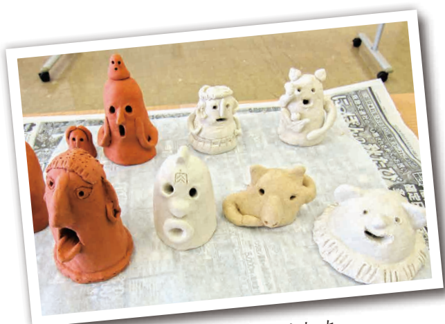
土偶づくりをしました

第2回 令和5年 7月22日(土) 第4回 令和5年11月25日(土) 第6回 令和6年 3月23日(土) ※第6回のみ 2階わくわくルームで開催