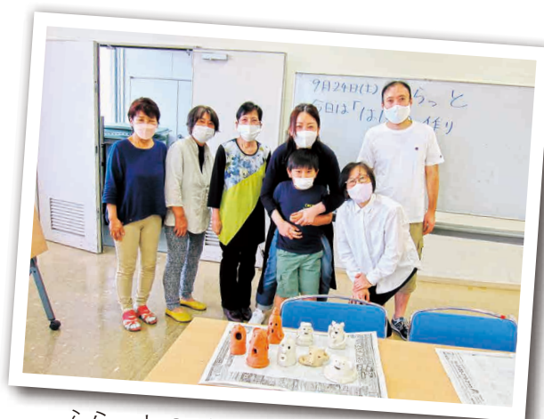
ふらっとのボランティアのみなさん