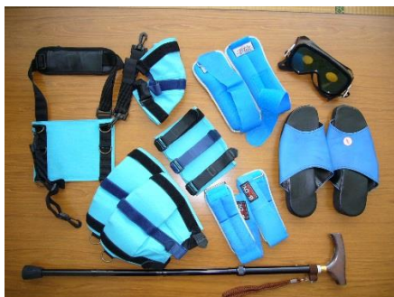
高齢者擬似体験セット