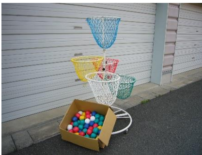
サークルバスケット

(スカット台)横 90cm×奥行 95cm (マット)横 90cm×長さ 500cm