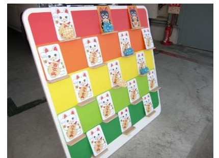
開運お手玉ボード

(本体)横 100cm×高さ 58cm×奥行 64cm (レーン)横 91cm×長さ 1000cm