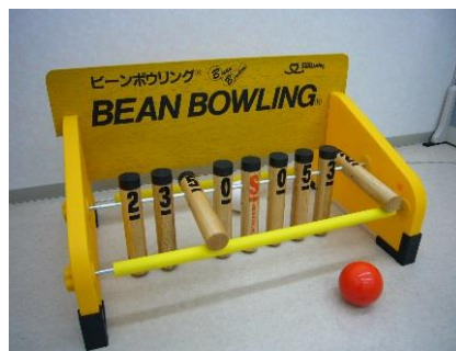
ビーンボウリング

(本体)横 100cm×高さ 58cm×奥行 64cm (レーン)横 91cm×長さ 1000cm