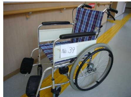
福祉体験・災害訓練用車イス