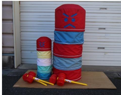
だるまおとし(大・小)