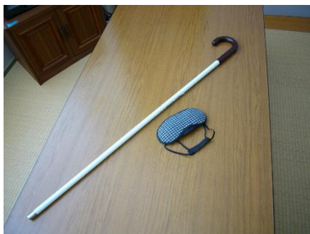
視覚障がい体験セット