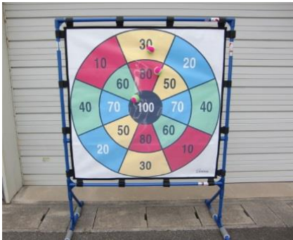
ターゲットゲーム